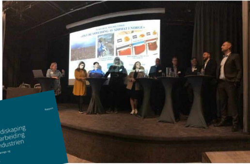
Næringspolitisk debatt.

Tirsdag 10. mai 2022 arrangerte Vest-Finnmark Rådet, i samarbeid med Øst-Finnmarkrådet, Nord-Troms Regionråd, Tromsøregionens interkommunale politisk råd, Midt-Tromsrådet, Lofotrådet og Troms og Finnmark fylkeskommune et seminar i Oslo, med fokus på hvordan vi kan oppnå målet om økt bearbeiding av sjømat i Norge. Totalt var det 56 deltakere på seminaret, fra Stortinget, Nærings- og fiskeridepartementet, FOU-aktører, bransjeorganisasjoner, sjømatbedrifter og representanter fra Troms- og Finnmark fylkeskommune og medlemskommuner i de 6 samarbeidende regionrådene.