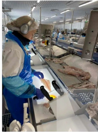
Filetproduksjon på Båtsfjordbruket.